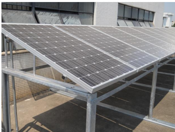
Gerador fotovoltaico conectado à rede -Belo Horizonte – MG

Local: Belo Horizonte - MG – Loja Elétrica – CCT - Centro de Capacitação em Tecnologia. Av. Dom Pedro II, 3703 - Bairro Padre Eustáquio - CEP: 30720-460.