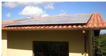
Gerador fotovoltaico conectado à rede Belo Horizonte – MG - Foto ilustrativa

Local: Belo Horizonte - MG - Loja Elétrica - CCT - Centro de Capacitação em Tecnologia. Av. Dom Pedro II, 3703 - Bairro Padre Eustáquio - CEP: 30720-460.