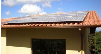
Gerador fotovoltaico conectado à rede Belo Horizonte – MG - Foto ilustrativa

Local: Belo Horizonte - MG – Loja Elétrica – CCT - Centro de Capacitação em Tecnologia. Av. Dom Pedro II, 3703 - Bairro Padre Eustáquio - CEP: 30720-460.